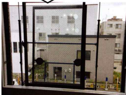
後ろ側の窓を外し、「イチオキ23」に置く