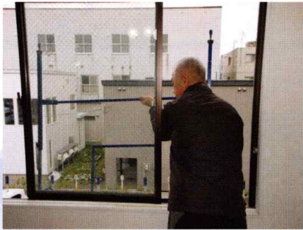
窓の外側に「イチオキ23」を取り付け

一般的な窓は、外側にしか外すことが出来ません。 窓を外す作業の場合、手前の窓から外すことは出来ず、後ろ側の窓を外して取り込んでから、手前の窓を外す作業となります。 後ろ側の窓を取り込む際に、手前の窓が障害となるため一人では取り込めず、二人以上の人手が必要でした。 その作業を補助してくれる器具が、「イチオキ23」です。