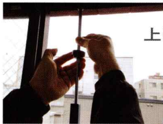
上は早締めナットで固定