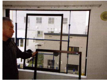
手前の窓を取り外して、後ろ側の窓を取り込む